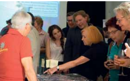
Alle, die sich beteiligt hatten, waren nicht nur aufgefordert, ihre Meinung kundzutun, sondern an der zukünftigen Planung mitzuarbeiten.

Für zukünftige Umgestaltungspläne sollte auf jeden Fall bedacht werden, dass es ein multifunktionaler Platz bleiben soll, auf dem die Menschen die Hauptrolle spielen, denn erst sie machen den Platz zum Hauptplatz!