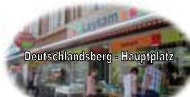
Deutschlandsberg - Hauptplatz

D a n k e an all jene, die ohnehin gerne bei uns einkaufen!