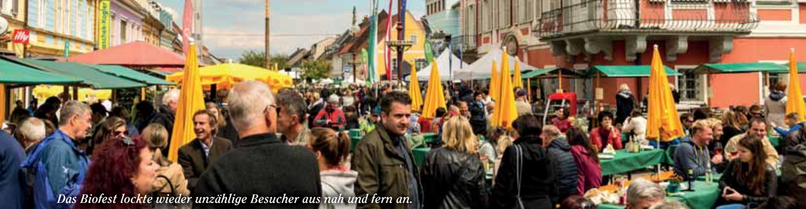
Das Biofest lockte wieder unzählige Besucher aus nah und fern an.