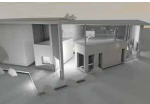
Die Eröffnung der Sporthalle ist für Herbst 2018 geplant. (Abbildung des Modells)

Obmann Uwe Binder freut sich, dass der Bau bereits heuer beginnt: »Die Baukosten belaufen sich auf etwa 450.000 Euro. Das Grundgerüst bleibt bestehen, trotzdem wird alles neu gemacht – alles verstärkt, erneuert und erweitert. Die Wohnung für den Hallenwart wird saniert, weiters ist ein Zubau eines Geräteraumes im Konzept inbegriffen. Zusätzlich gibt es einen großen Glaszubau, der auch der neue