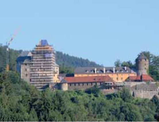
Die Baustelle Anfang Juni