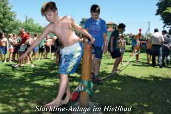
Slackline-Anlage im Hietlbad