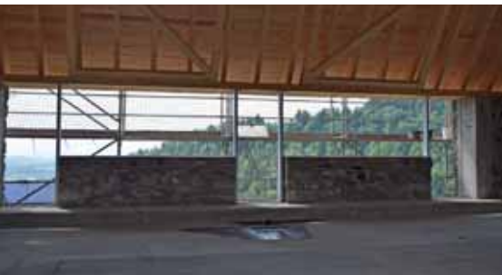
Die geplanten Glasfronten (siehe Aussparungen) ermöglichen weiterhin den herrlichen Ausblick auf unsere Stadt und die gesamte Region, zudem ist ein behindertengerechter Zugang vorgesehen.