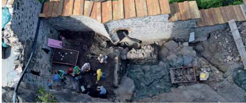
Blick auf die Ausgrabungen im Bereich Kernburg