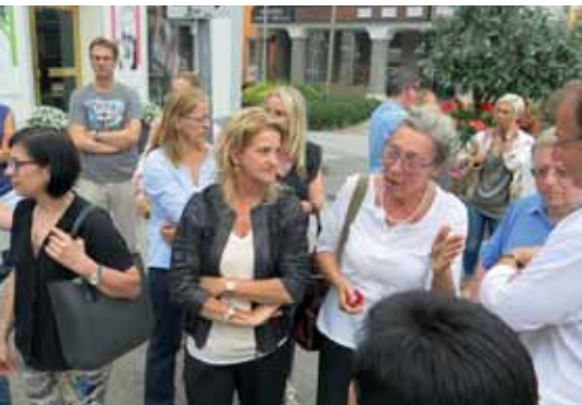
Mit ansässigen Geschäftsleuten fand zusätzlich eine Hauptplatzbegehung statt.