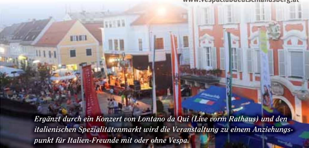
Ergänzt durch ein Konzert von Lontano da Qui (Live vorm Rathaus) und den italienischen Spezialitätenmarkt wird die Veranstaltung zu einem Anziehungspunkt für Italien-Freunde mit oder ohne Vespa.